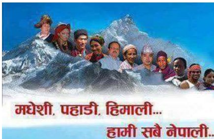
मधेशी, पहाडी, हिमाली... हामी सबै नेपाली...

सम्पादक/प्रकाशक : राजन कार्की Editor/Publisher : Rajan Karki सह-सम्पादक : शाश्वत शर्मा बनबाइन प्रविधि : रोशन कार्की कानुनी सल्लाहकार : शिवप्रसाद खिस्नेर मुख्य व्यवस्थापक : कृष्णकुमार कार्की व्यवस्थापक : हिलकुमार कार्की मुद्रण : तारा प्रिन्टर्स, कर्ली