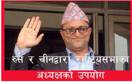
रूस र चीनद्वारा राष्ट्रियसभाका अध्यक्षको उपयोग

काठमाडौं। रूसले राष्ट्रिय सभा अध्यक्ष गणेशप्रसाद तिमिल्सिनालाई निम्त्यायो र नेपालमा आफ्नो पनि चासो रहेको सन्देश पठायो। रूसको सन्देश नेपाललाई मन, इच्छा, अन्य सहयोग गर्न चाहेको रूपमा आएको छ। गणेशप्रसाद तिमिल्सिनाले सरकार प्रमुख मै हुँ जसरी रूससँग वार्ता गरेका छन् र सहयोगको प्रस्ताव पनि गरेका हुन्। उनी नेपाल नफर्कदै रूसले नेपालबाट रूस जाने खुलालाई भिजिट भिसामा नरामना अपनायो र युवाहरू रूस जान थालेका हुन्। यतिबेला रूसको सेनामा नेपाली गोर्खा पठन बनेको छ। युवाहरू रूसी सेना, बानजरजुटा भाडाको सिपाही दस्तामा भर्ती भएर युकेनविस्ड लड्न जाने विषयले नेपालको नीतिमा ठोस पुगेन ? रूसपछि चीनले निम्त्यायो। चीनले राष्ट्रियसभाका अध्यक्ष गणेश तिमिल्सिनालाई जन राजनीतिक परामर्श दातु सम्मेलन (चाइनिज रिपब्लिक पोलिटिकल कन्सल्टेन्टिभ कन्फरेन्स) मा अध्यक्ष वाड हुँ निडले निम्त्याएका थिए। नेपालमा चीन विरोधी गतिविधि नहोस् भन्ने चीनको चाहना छ। भनेर सन्देश पठाए। यद्यथा चीनले यो प्रतिक्रिया राष्ट्रियसभा अध्यक्ष मार्फत नेपाल सरकार र नेपाली राजनीतिक दलहरूलाई