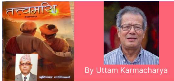
By Uttam Karmacharya

Once you have a rough idea of the structure we can begin plotting out the events, e.g. what happens and when does it happen? If we