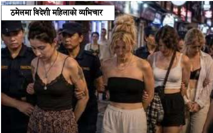
उमेल, पर्यटक केन्द्रमात्र होइन, वैश्यवृत्तीको अखडा पनि बनेको खुलासा भएको छ। हालै प्रहरीले विदेशी ९ युवतीलाई रंगीत फकाउ गरेपछि उनीहरू सहज भएकाले नेपालमा वृथावृत्ति गरेर कमाउन आएको बयान दिएका छन्।