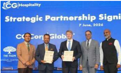
काठमाडौंमा दुई विश्वप्रसिद्ध लक्जरी होटल स्थापना गर्नका लागि यारिएट इन्टरनेशनल र सीजी होस्पिटालिटी शोबलबोच सहमति भएको छ। द रिट्ज-कार्लटन (उमेल) र द वेस्टिन सञ्चालन गर्ने सहमति भएको छ। यी दुवै होटल चौधरी ग्रुप, आईईजी, आईजे र शर्मा एन्ड कम्पनीको सार्कदारीमा निर्माण हुनेछन्। यी होटलहरू सन् २०३१ सम्ममा सञ्चालनमा आउन जनाइएको छ।

अहिलेसम्म भएका होटलबन्दा भिन्न यी दुवै होटलमा अत्याधुनिक सुविधाहरू, रेस्टरन्ट, स्पा र ठूला हलहरू र अन्य विशेष सुविधाहरू रहनेछन्। यो सहकार्यले नेपालको पर्यटन प्रवर्द्धन, रोजगारी सिर्जना र आर्थिक विकासमा महत्त्वपूर्ण योगदान पुऱ्याउने विश्वास लगायीकर्ताको रहेको छ। स्म्यारिड र सीजी होस्पिटालिटीको विश्वमा बलियो सार्कदारी रहेको व्यावसायिक सम्बन्ध अरु बढ्ने देखिन्छ।