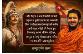
वर्णको साम्राज्यवादी हो, यसलाई सबै मिलेर सम्हाल्नुपर्छ ।

विधिधर्माभियको सुन्दर एकता नै यो देशको मूल सौन्दर्य र अमेध शक्ति दुवै हो भन्ने कुरालाई विमर्श आज राज्य सञ्चालकहरू विदेशी एजेन्डाको भारी बोक्रिहेका छन् । पूरवीनायक शाहले यो देशलाई कुनै एक भिन्नचित जात, धर्म वा वर्णको संकुचित पैसा मानेनन्, बु भूगोलीय बन्ने सबै नागरिकको समान हक र अपनत्व भएको एउटा विशाल साम्राज्यवादी राज्यको सञ्चालन गरे । कसैलाई पनि पाखा र कसैलाई काखा नगरी सबैको सांस्कृतिक पहिचानको संरक्षण, सम्बर्द्धन र समतामूलक विकास गर्नु नै आधुनिक कल्याणकारी राज्यको मूल धर्म हो भन्ने मार्गदर्शन यसले प्रदान गर्दछ । यसका साथै, दिव्य उपदेशले नेपाललाई असली हिन्दुराज्यको यममा गौरवका साथ परिभाषित गरेको पाइन्छ । यहाँ हिन्दुस्तानु भन्नुको कुनै संकुचित, सांस्कृतिक वा राजनीतिक अर्थ होइन, बल्कि यो त वेदव्यासको यवान तपोभूमि, शाक्यमुनि बुद्धको शान्तिभूमि, देवाधि र राजपिण्डको चिन्तनभूमि एवं योग र अध्यात्मको शाश्वत उद्गमस्थल ( देवभूमि) को मौलिक पहिचान हो । आधुनिकता र पश्चिमाकरणको अन्धो, विवेकहीन अनुकरण गर्ने नाममा आज हामीले आ' नै रैथाने मौलिकता, सनातन मूल्यमान्यता र सांस्कृतिक धरोहरको निम्न श्राद्ध गरिरहेका छौं ।