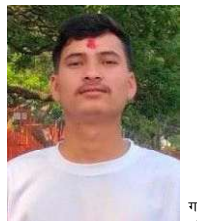
प्रवीण बयक एवंज्वल विद्यविद्यालय

पर्दछ । त्यहाँका-उत्पादन राज्यले पहिलो प्राथमिकता दिएर किन्ने पनि नीति बनाएर देशबाट मगल्ने, बेवारीसे र सडक बालबालिकाको व्यवस्थापन गर्नुपर्ने अनिवार्य नीति हुनु पर्दछ । सुकुम्बारी र पुनर्वास योजना : नेपालको पुरातन समस्या भनेकै सुकुम्बारी समस्या हो । भूमिहीन र सक्की सुकुम्बारीको समस्या समाधान नभएको समस्या बढ्दो छ । यो समस्या समाधानका लागि राजगरीको वृद्धि र व्यवस्थापनको नीति अब्बल हुनेपर्छ । अचल सम्पत्तिको, रोजगारविहीन तथा रोजगार गर्ने सीपविहीन व्यक्ति सुकुम्बारी हुने । जग्गा बाँडे र सुकुम्बारीहरूको समस्या समाधान गर्न गरिएका प्रयासहरू र कृषियन्त्र पुनर्वास गर्ने गरेका प्रयत्नबाट यो समस्या कहिल्यै समाधान गर्न सकिने । यो निरर्थक प्रयास हो । यस्ता एकाइलाई खारेज गरी सबै व्यक्तिले पूर्ण रोजगार र आयस पाउने, ब्यवस्थित वस्ती, चाउका प्रणाली र पारिवारिक स्थिति काई बमोजिम गैर कृषियन्त्र, धेरैलुजन्त उद्योगबाट आवास र रोजगार प्रदान गरिने कार्यक्रम बनाइनु पर्दछ । यसले मात्र कसैलाई सुकुम्बारी हुन दिदैन ।